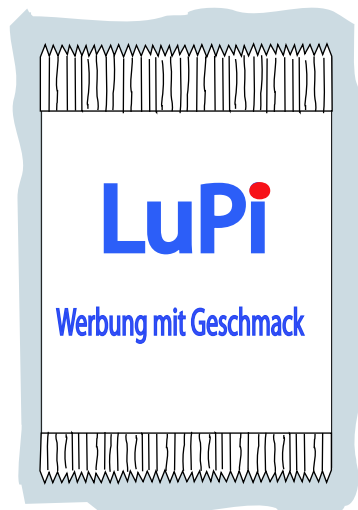
Weißfeld No2 Vorderseite weiß Rückseite glasklar