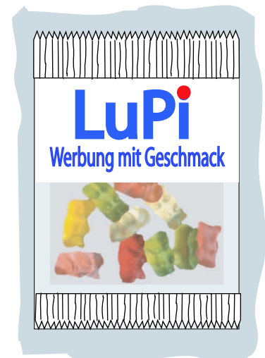
Weißfeld No3 Obere Hälfte weiß untere Hälfte glasklar