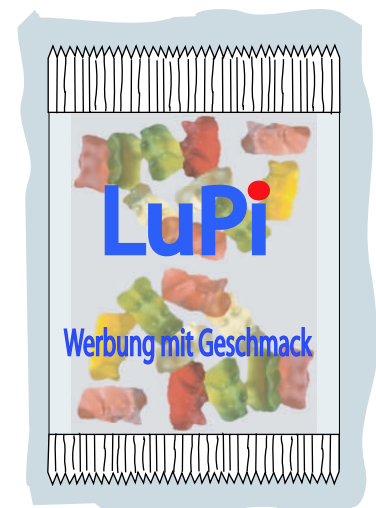
Glasklare PP Folie