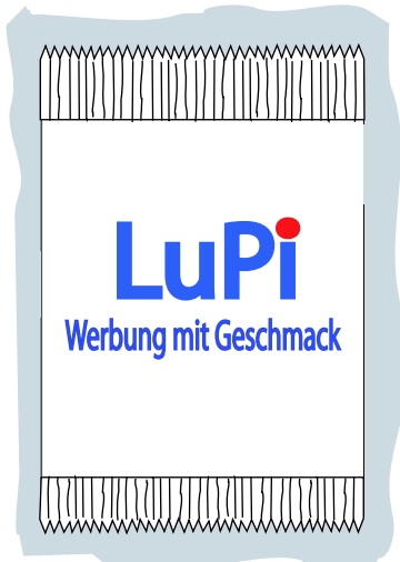
Weißfeld No1 Gesamtes Tütchen weiß

Glasklare Folie erfordert gegebenenfalls weiße Unterlegung damit die Farben nicht transparent erscheinen. Weißfelder können als Hinterlegung Ihres Motivs dienen. Sie werden von uns als kostenloser Service für Sie angeboten. Die Weißfelder sind fest angelegt und können nicht verändert werden.