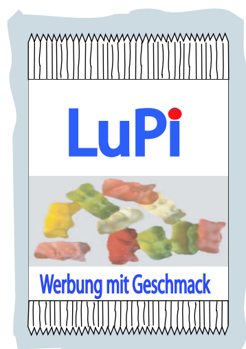
Weißfeld No5 Obere Hälfte weiß Mitte glasklar untere Hälfte weiß (10mm)